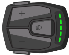
ECO Stand - tot 12Km