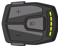
TURBO Stand - tot 22Km