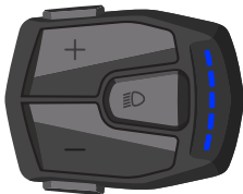
SPORT Stand - tot 18Km