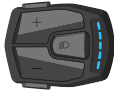
TOUR Stand - tot 15Km