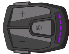
BOOST Stand - tot 25Km